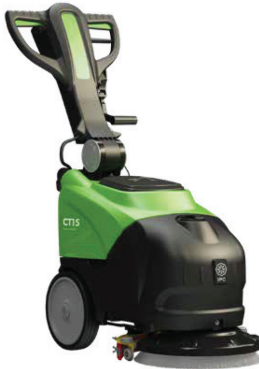
VERSION MIT WALZE